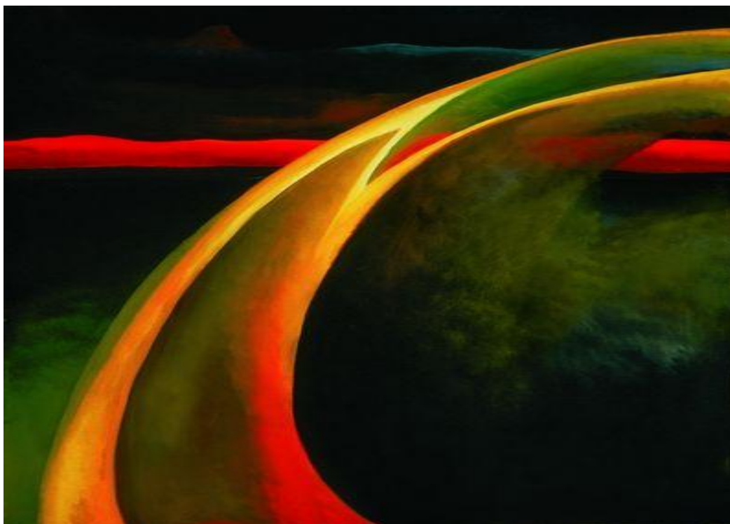
Obra de O'Keeffe