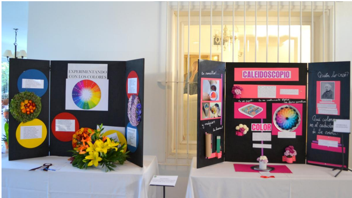
Primer Premio Maggie QUADE de CISNEROS