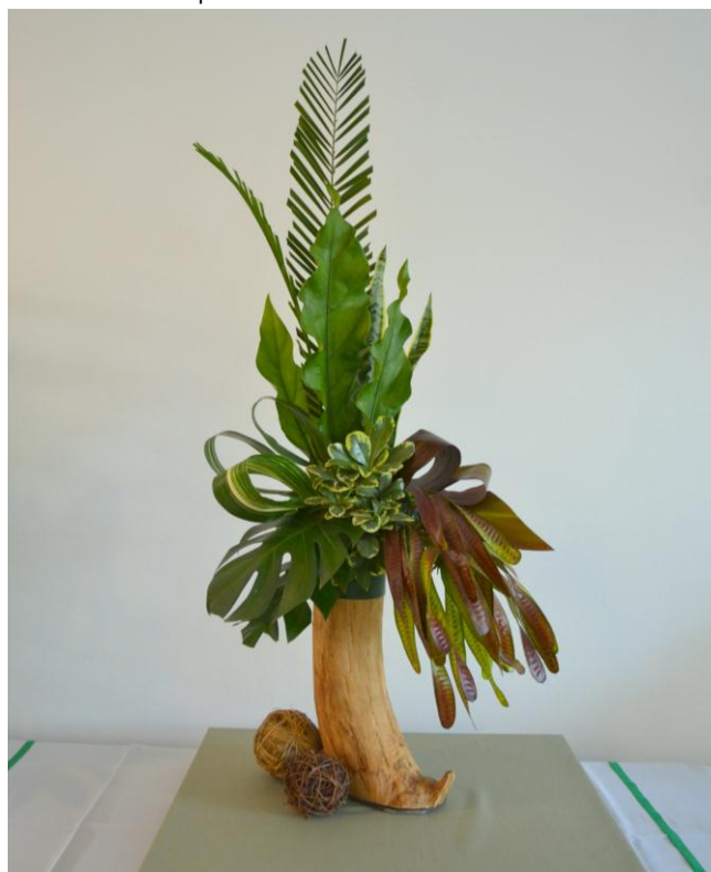
Tercer Premio Silvana Ginocchio de Jalil